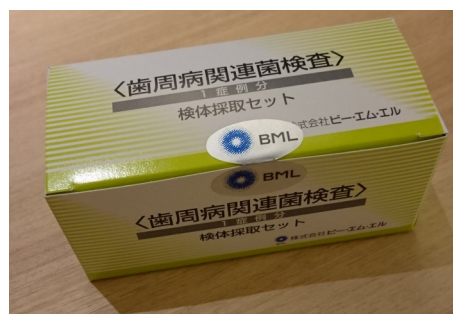
BML社の歯周病検査キットを 사용합니다